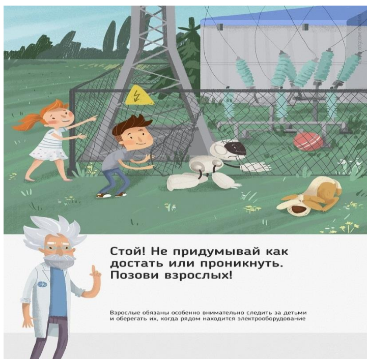
Рис. 5 Стой! Не придумывай как достать или проникнуть. Позови взрослых!